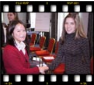
Doğru el sıkışmanın bile öğrenilmesi gerekiyor