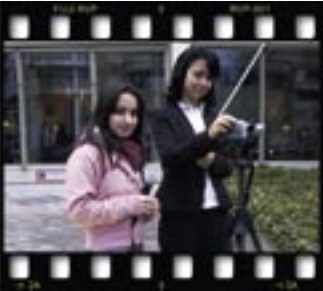
Kamera ekibi hep yanımızdaydı

Seminerin sonunda bize bir sertifika ile öğrendiğimiz tüm doğru davranış kurallarını içeren birer dosya verildi. Bu seminer hepimizin çok hoşuma gitti. Şimdi, doğru davranış kurallarını daha iyi biliyoruz.