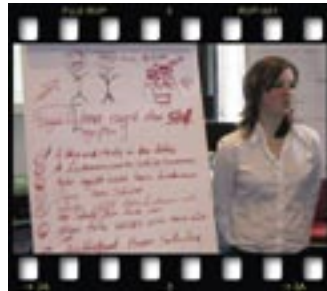
Sakın unutmayın: Önce sefinizi selamlayın.