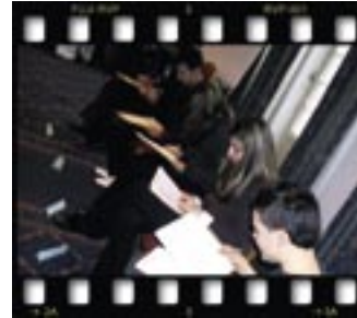
Doğru davranış kuralları bilgi yarışmasında hepimiz terledik.