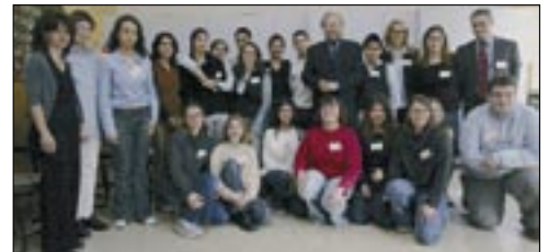
Federal Meclis Başkanı Wolfgang Thierse, 2003 yılında Offenbach'ı ziyareti sırasında görülüyor. Fotoğrafta bizi tanıyabildin mi?