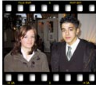
Hakikaten güzel değil miyiz?